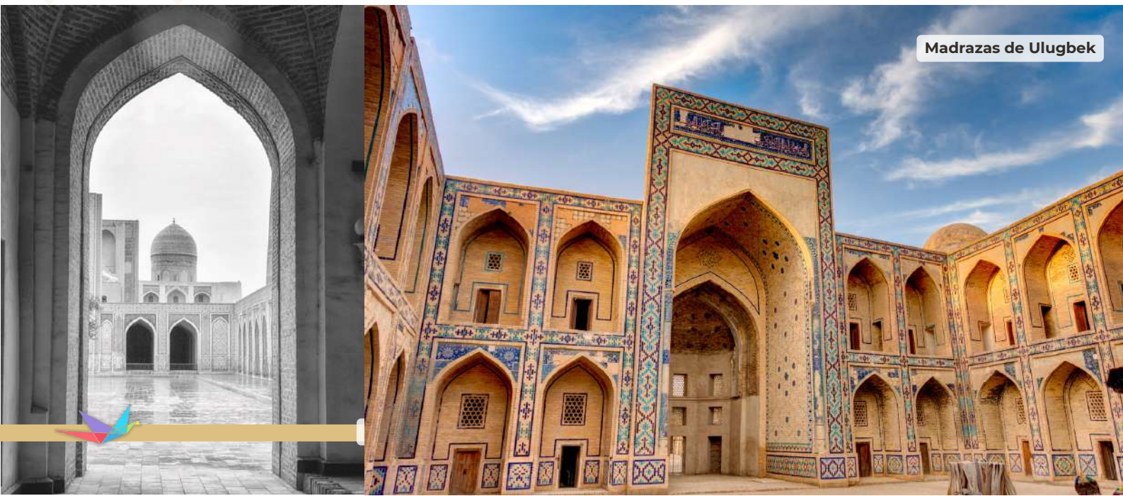
Madrazas de Ulugbek