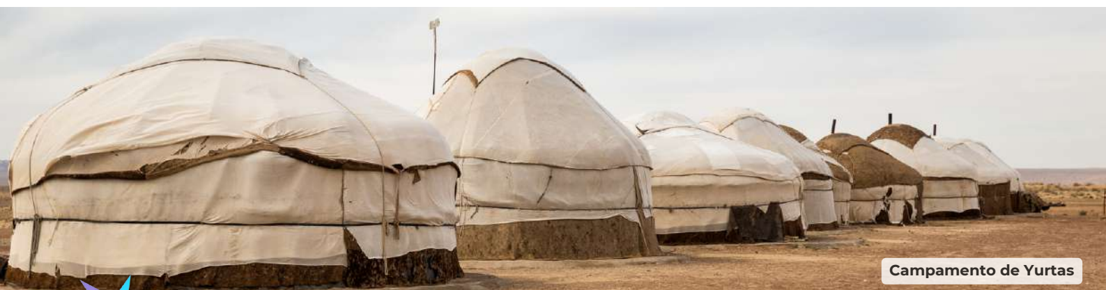
Campamento de Yurtas

Traslado, alojamiento y noche en el hotel de Bujará.